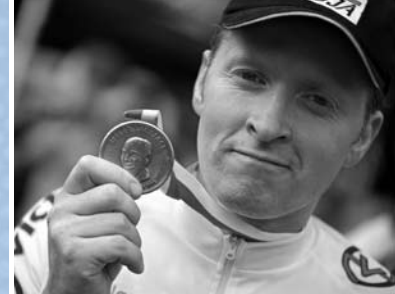
Joey Kelly Unternehmer & Ausdauersportler

Joey Kelly referiert in seinem Vortrag eindrucksvoll seinen Lebensweg als Unternehmer und Ausdauersportler, den er mit Ausdauer, Zielen, Willen und Leidenschaft konsequent verfolgt. Es begann alles mit einer Wette... - Ausdauersport als Ausgleich zu seiner Arbeit mit der legendären „Kelly Family“.