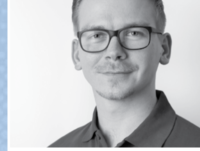
Tobias Jahn Petereit Services, a Google Partner

Die Internet-Suchmaschine Google wurde 1998 in den USA ins Leben gerufen. Basis des Erfolges ist die einfache Darstellung der Suchergebnisse und vor allem die deutlich höhere Relevanz der Suchergebnisse im Vergleich zu anderen Suchmaschinen. Mittlerweile ist Google die erfolgreichste Suchmaschine der Welt und mit einem Marktanteil von weit über 90 % in Deutschland ist sie das Maß aller Dinge für Nutzer und Webseitenbetreiber. Neben der Suchmaschine selber ist dessen Video-Plattform YouTube die zweitgrößte Suchmaschine der Welt und trägt maßgeblich zum Erfolg von Google bei.