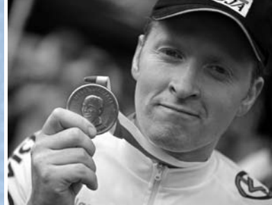
Joey Kelly Unternehmer & Ausdauersportler

Joey Kelly referiert in seinem Vortrag eindrucksvoll seinen Lebensweg als Unternehmer und Ausdauersportler, den er mit Ausdauer, Zielen, Willen und Leidenschaft konsequent verfolgt. Es begann alles mit einer Wette... - Ausdauersport als Ausgleich zu seiner Arbeit mit der legendären „Kelly Family“.